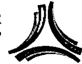
TABLA DE APLICABILIDAD DE LAS OBLIGACIONES DE TRANSPARENCIA ESPECÍFICAS 2016 DE LA SECRETARÍA DE TURISMO

Artículo 71. Además de lo señalado en el artículo anterior de la presente Ley, los sujetos obligados de los Poderes Ejecutivos Federal, de las Entidades Federativas y municipales, deberán poner a disposición del público y actualizar la siguiente información: