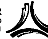
TABLA DE APLICABILIDAD DE LAS OBLIGACIONES DE TRANSPARENCIA COMUNES 2016 DE LA SECRETARÍA DE TURISMO

Artículo 70. En la Ley Federal y de las Entidades Federativas se contemplará que los sujetos obligados pongan a disposición del público y mantengan actualizada, en los respectivos medios electrónicos, de acuerdo con sus facultades, atribuciones, funciones u objeto social, según corresponda, la información, por lo menos, de los temas, documentos y políticas que a continuación se señalan: